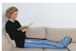
Comfy Benmanschett med blixtlås och en luftkammare i foten