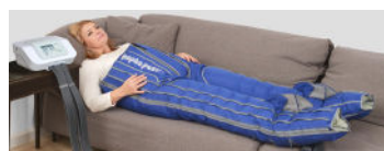
Byxmanschett Standard eller XL