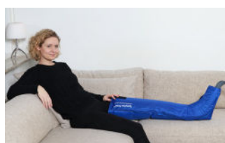
Benmanschett med karborrband och fyra luftkammare i foten