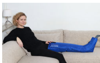
Benmanschett med karborrband och fyra luftkammare i foten