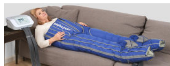
Byxmanschett Standard eller XL