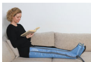
Comfy Benmanschett med blixtlås och en luftkammare i foten