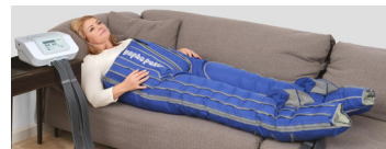
Byxmanschett Standard eller XL