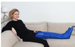
Benmanschett med karborrband och fyra luftkammare i foten