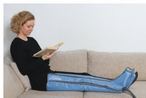
Comfy Benmanschett med blixtlås och en luftkammare i foten