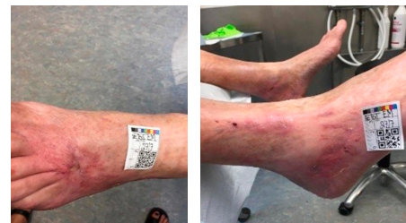
Juli 2017: Sår på venstre og højre ben

Januar 2017: Forværring af bensår på begge underben. Personalet på bostedet har til dato varetaget den daglige sårbehandling. Opstarter forløb i Sygeplejeklinikken ved sårsygeplejerske 2 x ugentlig.