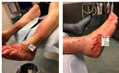
Februar 2017: Sår på venstre og højre ben

Bor på et psykiatrisk bosted. Anvender ikke stationært kompressionsstrømper pga. manglende compliance og smerter.