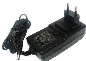
Netadapter med ledning