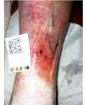
Dag 67 (9 ½ uge)

Der er fra projektstart til sårheling anvendt i alt 7 ½ PolyMem bandage.