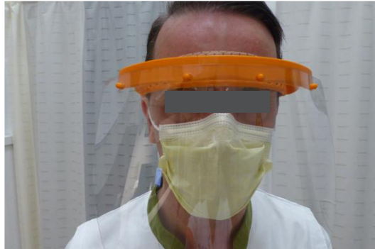
På panden under visir