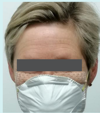
På næseryg og kinder under maske